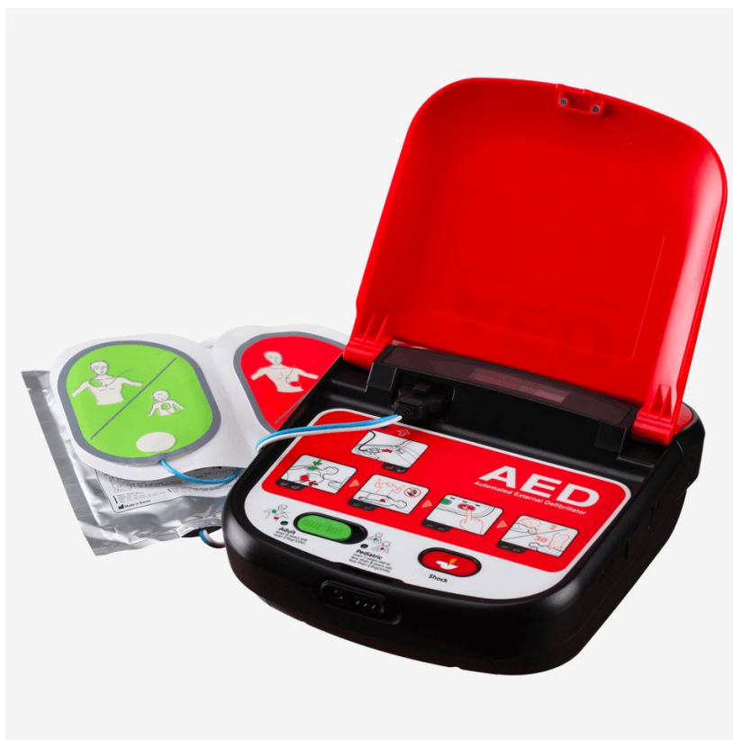
Hjertestarter med låg og elektroder isat stikket.